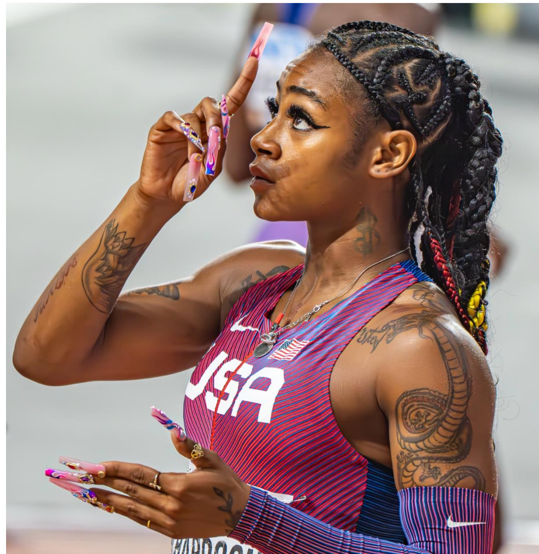
Foto: Dick Nilsson, Halmstad Fotoklubb. Hämtad ur "Vill du synas med dina bilder?"

RSF, Riksförbundet Svensk Fotografi, är paraplyorganisation för 135 fotoklubbar runtom i Sverige. Tillsammans i klubbarna och med våra Direktmedlemmar är vi 6500 fotograferande medlemmar. Etablerades 1946. Sveriges Fotoklubbskarta